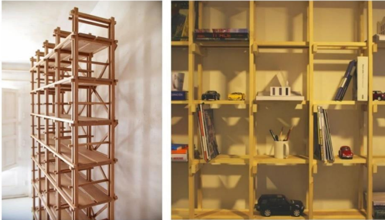
Imagen, estantería (Referencial)

Para soportar todo tipo de artefactos relacionados a las oficinas de la corporación y para dividir recintos entre sí, se propone un entramado de madera vertical y diagonal de madera de pino, cepillada y seca / premium 1 x 2' y 6 x 1', fijadas a través de pernos de anclaje autoroscante 5cm para arriostrar cada listón de madera, cada una de ellas especificada en el plano correspondiente de detalles constructivos, se aplicara en las estanterías, protector de madera en color miel, con el número de capas que indique el fabricante.