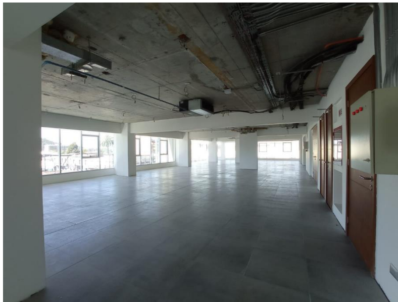
Imagen, situación existente piso a intervenir

A considerar: el estado actual del piso 4, conexiones eléctricas en un tramo, por lo que estará a disposición de los maestros para realizar los trabajos correspondientes, están habilitados 6 baños, los cuales están en actual funcionamiento. El nivel, se encuentra actualmente con piso grafito de 65x65 cm, el cual se conservará, las paredes están pintadas en color blanco, las cuales también se conservarán. Dadas las preexistencias del nivel, las intervenciones que se presentan en la licitación, contemplan, penalización en vidrio con marcos de aluminio, instalación de biombos de madera, habilitación de las oficinas involucradas, incluye fabricación de muebles a la medida, (indicadas en las presentes ee.tt. Las demás intervenciones asociadas se indican a continuación, con sus respectivas especificaciones.