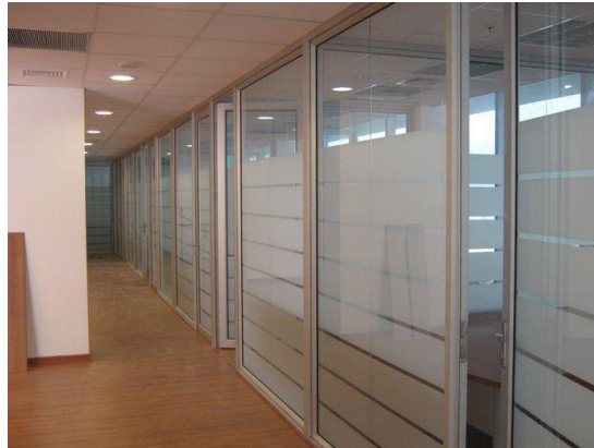
Imagen, tabiquería tipo a construir (referencial)